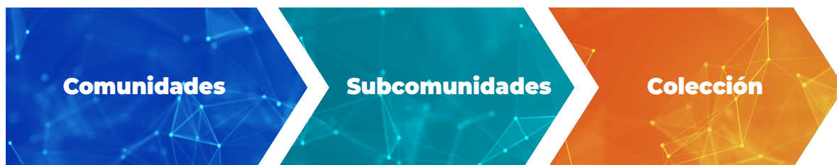
Gráfico N° 3: Organización de los contenidos en un RI

La decisión del modo como las colecciones son establecidas dentro de las comunidades también debe ser tomada en concordancia con la política del repositorio y puede variar según la comunidad.