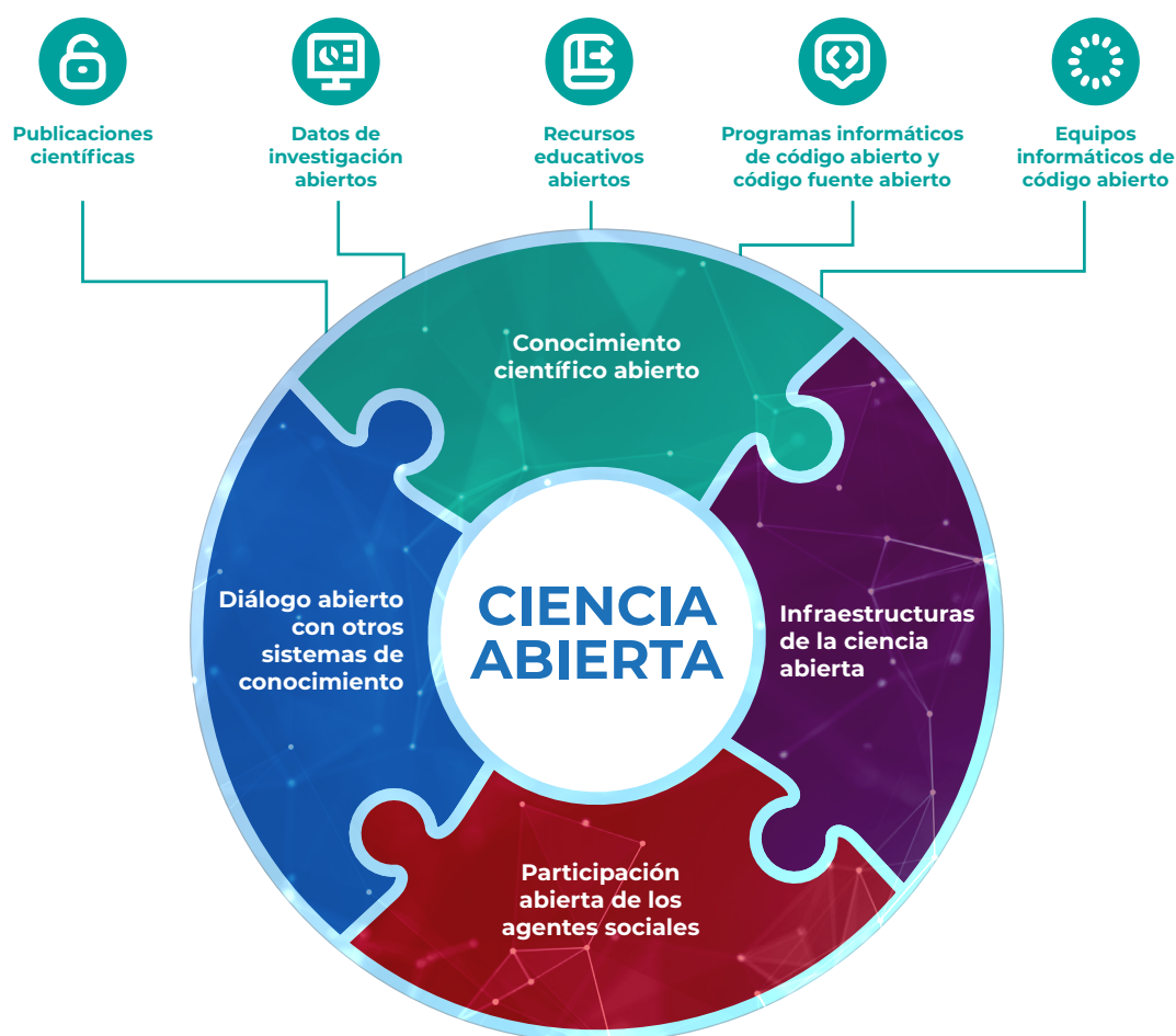
Gráfico N°1: Conocimiento científico abierto

La UNESCO (2023) considera el acceso abierto (en inglés, Open Access, OA) un derecho básico que permite a todas las personas acceder y utilizar la información digital. El acceso abierto, como lo define